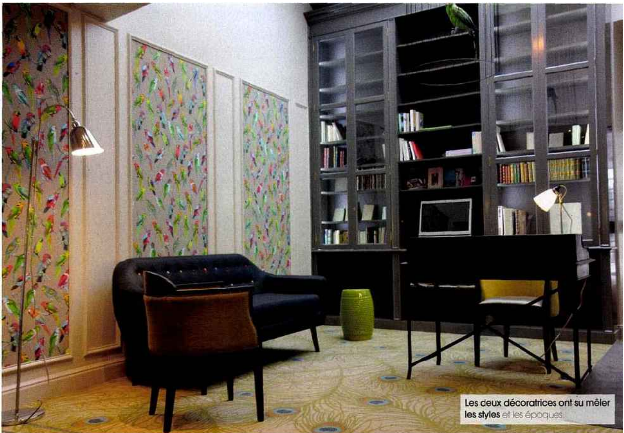
Les deux décoratrices ont su mêler les styles et les époques.