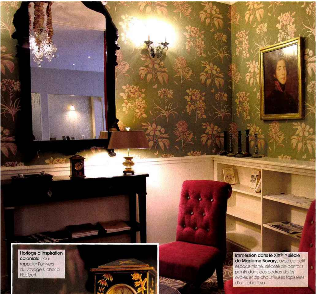
Horloge d'inspiration coloniale pour rappeler l'univers du voyage si cher à Flaubert.