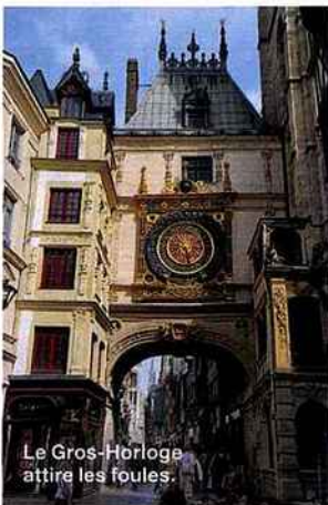
Le Gros-Horloge attire les foules.

La capitale de la Normandie possède un centre historique, joyau de l'art gothique. De ces dentelles de pierre à la Seine, faites un bond de neuf siècles... en deux jours !