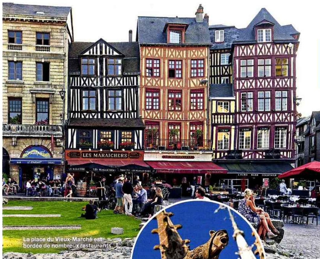
La place du Vieux-Marché est bordée de nombreux restaurants